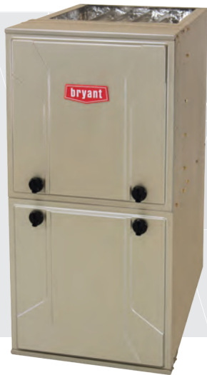
Modelos 926T y 926S